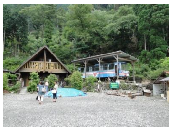
【ランチタイム】 レールバスの見学