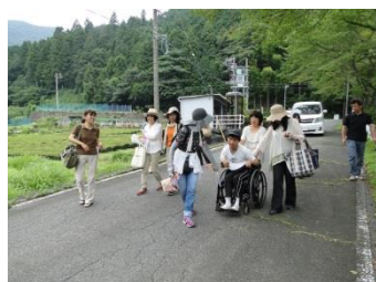
【日当駅から根尾川鉄道文化村に移動】