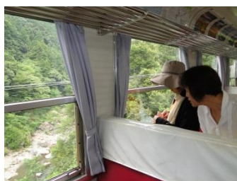
【移動】 車窓から根尾谷溪谷