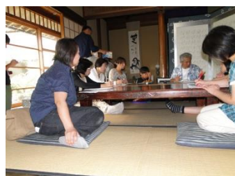
【NPO 法人樽見鉄道を守る会