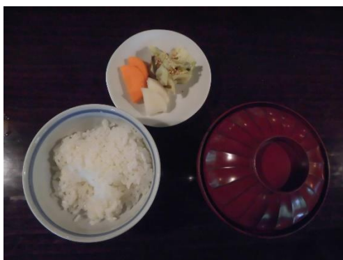
ご飯、味噌汁、香の物