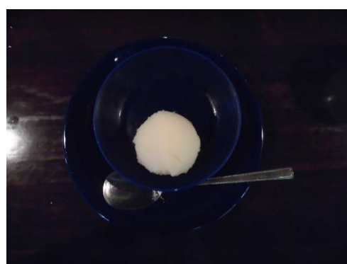
カボス シャーベット