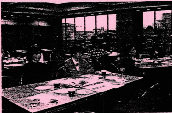
『女性建築士会のつどい』より

これからも、女性建築士ならではの発想で、士会を盛り上げて頂きたいと願っています。