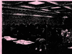
『女性建築士会のつどい』より