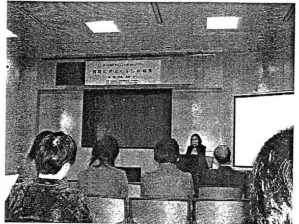
わたらしいすまいづくり セミナー風景

◆2月20日(サンプルスガーデンホテル) ブロック事業委員会と女性建築士協議会会議が行われ、その後青年部と合同閉会式が名古屋都市センターにて行われ、2日間にわたったブロック会議が終了しました。