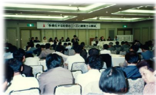
第32回建築士会全国大会岐阜 於:メモリアルセンター