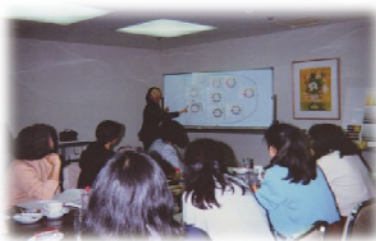
1994年4月ミニ研修会「カラーコーディネート」