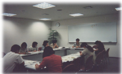
1994年ミニ研修会「理学療法士福祉部会との交流会」