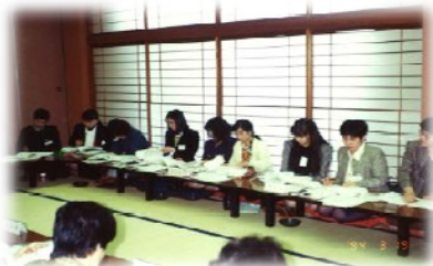
1994年3月 東海北陸建築士ブロック会女性建築士協議会 富山会議