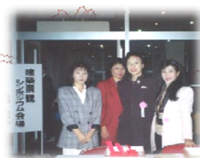
1990年1月 建築景観シンポジウム