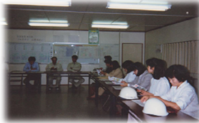
1993年9月 関市 ナベヤ事務所棟・迎賓館見学会