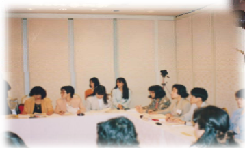
1993年7月 東海北陸建築士ブロック会女性建築士協議会 岐阜会議