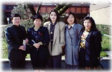
1993年3月 金沢 東海北陸建築士会ブロック会女性建築士協議会 石川会議