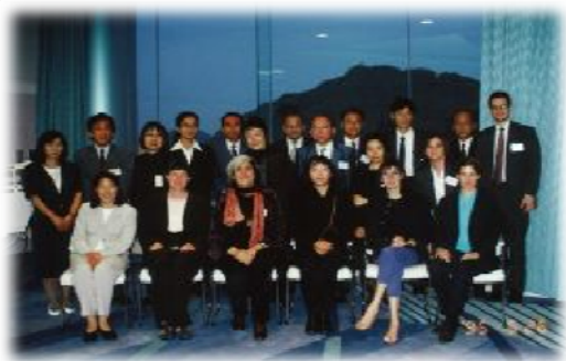
1995年5月 国際女性フォーラム 県民ホール未来会館